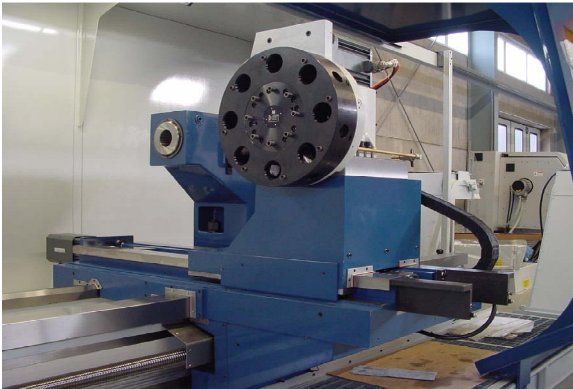
SAUTER 8-fach Werkzeugscheibe 0.5.901.025/473 / VDI 50 oder VDI 60

Nagel Werkzeug- Maschinen GmbH PF 31 60, 89021 Ulm Benzstraße 1 89079 Ulm Telefon (07 31) 4 98-770 Telefax (07 31) 4 98-761 info@nagel-gruppe.de