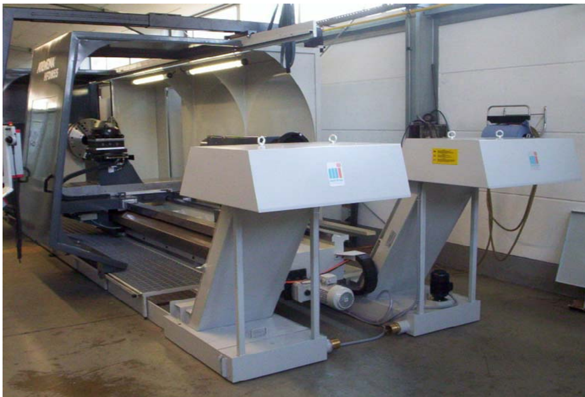
Späneförderer rechts + links Hersteller Mayfram

Nagel Werkzeug- Maschinen GmbH PF 31 60, 89021 Ulm Benzstraße 1 89079 Ulm Telefon (07 31) 4 98-770 Telefax (07 31) 4 98-761 info@nagel-gruppe.de