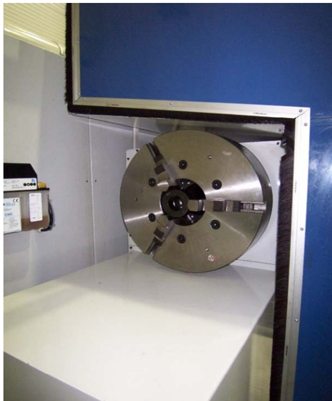
Gegenfutter nach Kundenwunsch

Nagel Werkzeug- Maschinen GmbH PF 31 60, 89021 Ulm Benzstraße 1 89079 Ulm Telefon (07 31) 4 98-770 Telefax (07 31) 4 98-761 info@nagel-gruppe.de