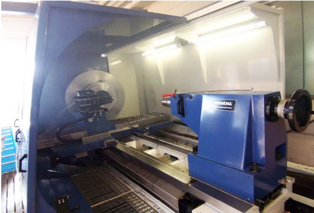
Reitstock federgelagert Metrisch 80 mm